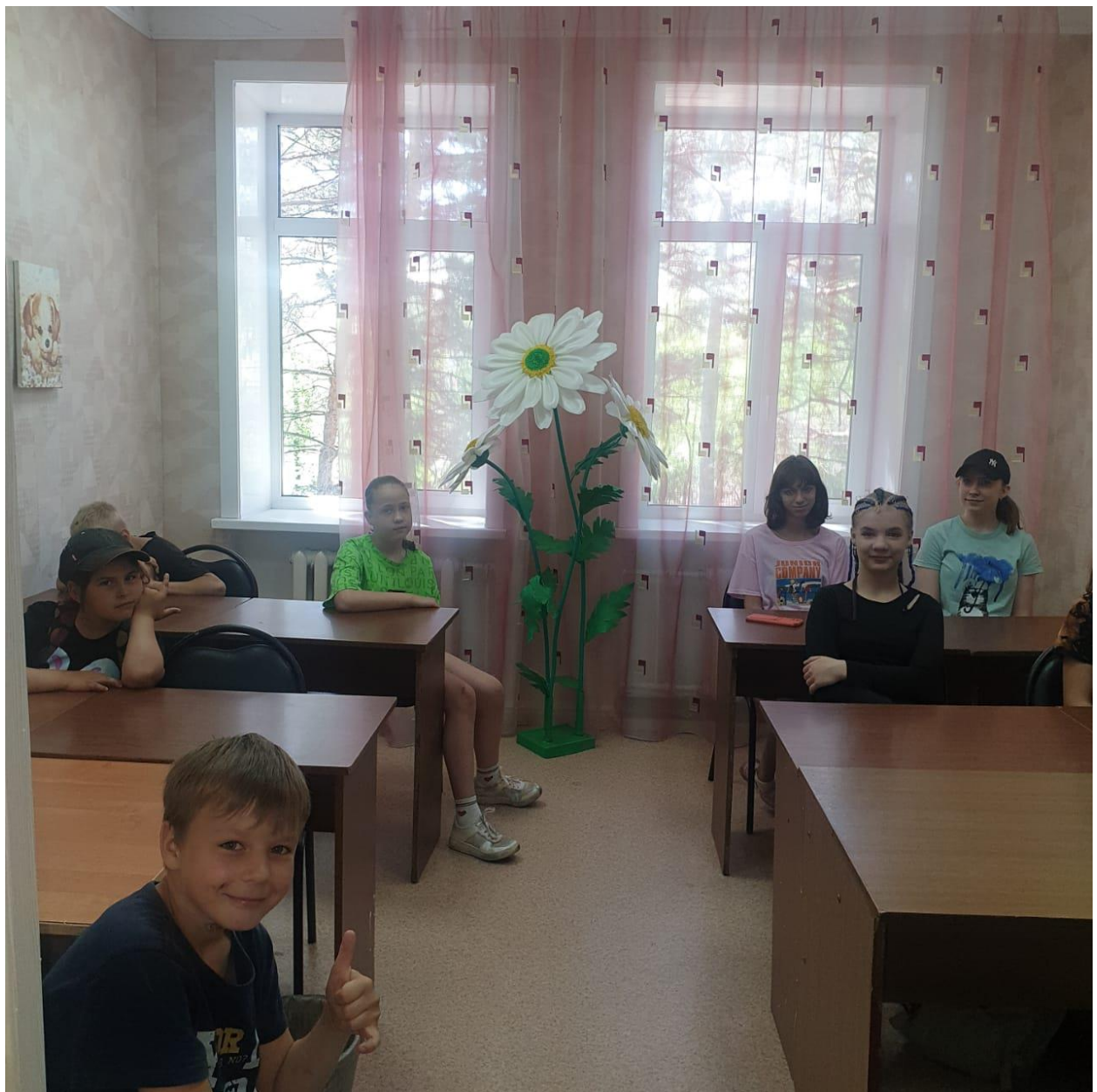
Дети посетили МБУ «Белогорский краеведческий музей им. Н.Г.Ельченинова»